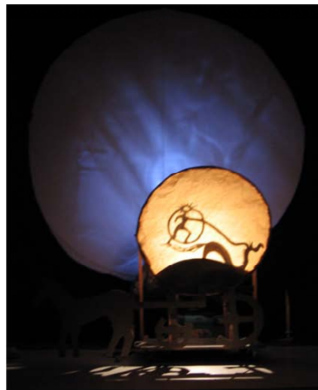
Recherches pour l'Homme Lune et la Femme Soleil