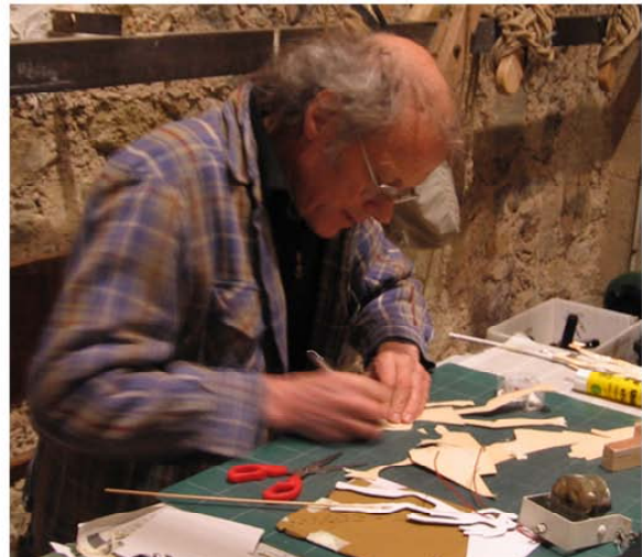
Le plasticien au travail