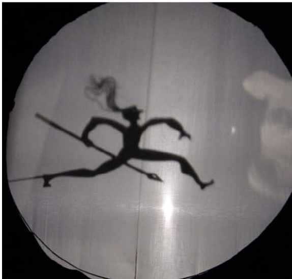
Images de répétitions à Tessy sur Vire : Silhouette d'Odin attaquant