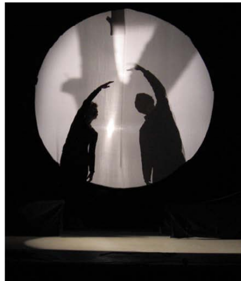
Images de répétitions à Tessy sur Vire - Juin 2011