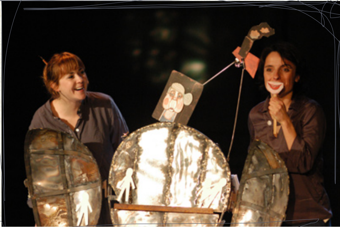
« Le monde point à la ligne »