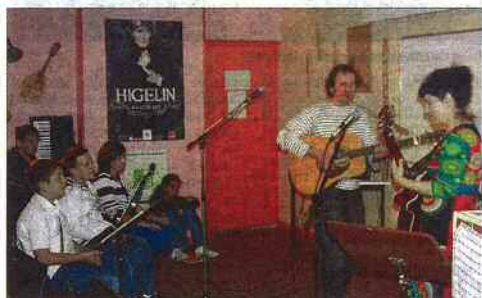
Deux artistes généreux qui ont conquis les ados

Cette rencontre a été très enrichissante grâce à un échange passionnant et chaleureux. Les ateliers consistaient à montrer aux jeunes