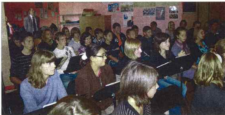
L'échange a été chaleureux

comment naît une chanson, comment l'écrire et la mettre en musique. Deux compositions (qui deviendront les tubes du collège, c'est sûr !) ont ainsi été créées. La première sur un air de blues intitulée LOL et la seconde plus pop J'ai