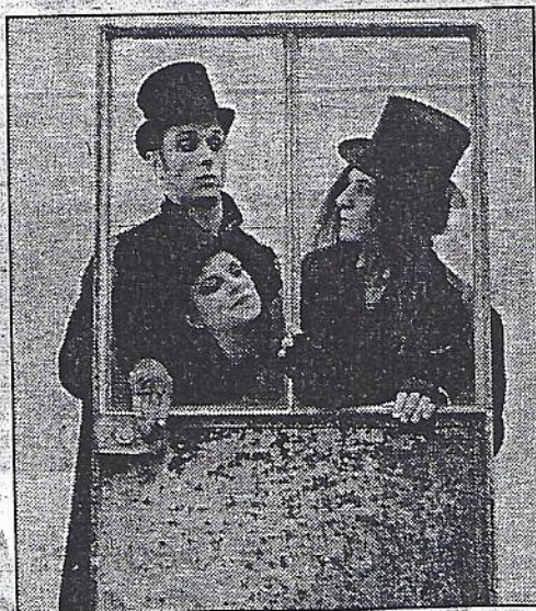
Cruelles Sornettes est un spectacle décalé.